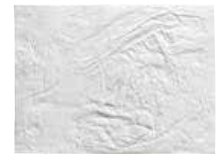
Puros Pericardium Membran