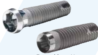
Tapered Screw Vent