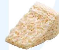
Puros Block Allograft