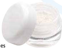
Puros Cancellous Particles