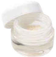
Puros Cortical Particles