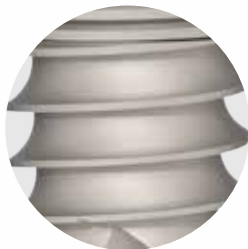
Payanda Kare Formlu Yiv Kesiti