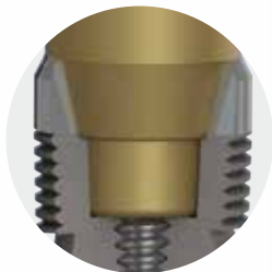
Morse Taper Konikal Bağlantı