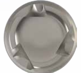
Üç Ağızlı Çentik Yapısı ve Düz Sonlanan Apex Dizaynı