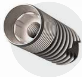
Oktafiks Konik Bağlantı